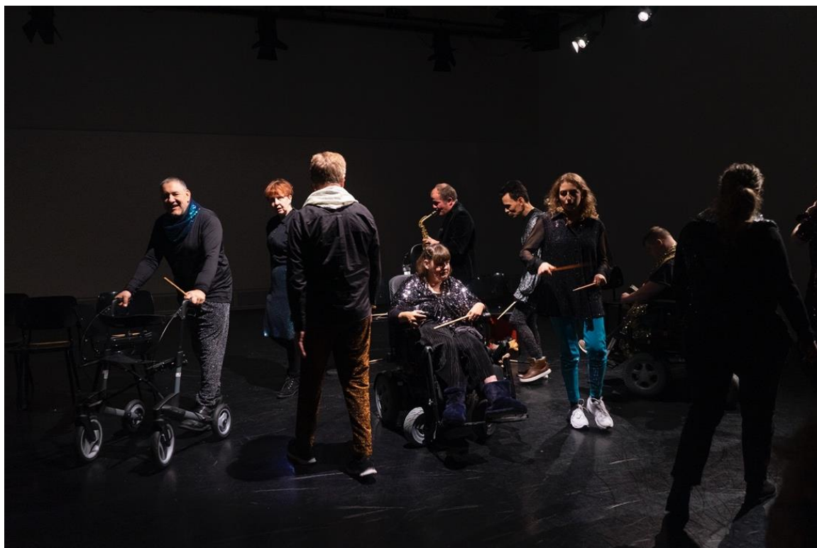
Speels Collectief, 2019